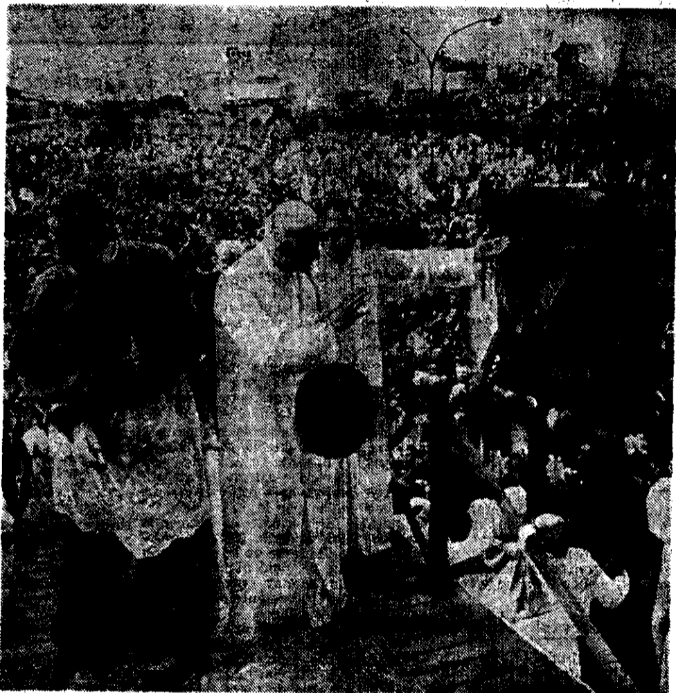
EL PAPA JUAN Pablo II saluda a la multitud estimada en más de dos millones de fieles, que se congregó en la Basílica de Luján.