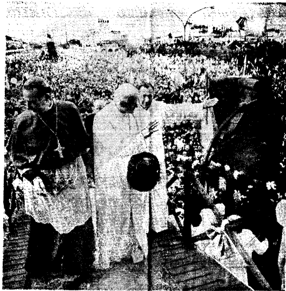
EL PAPA JUAN Pablo II saluda a la multitud estimada en más de dos millones de fieles, que se congregó en la Basílica de Luján.