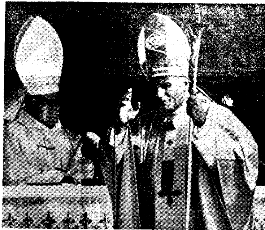
JUAN PABLO II se disponía a officiar misa ante más de un millón de fieles congregados al aire libre ayer en Buenos Aires, en el último acto oficial de la visita de dos días que el Padre Santo hizo a la nación argentina.

que superó a las rencillas individuales y que unió razas, tapizada de emotividad, euforia, fanatismo, locura de fe, misticismo y alegría explotada en miles de banderas de plástico con los colores de Argentina y del Vaticano.