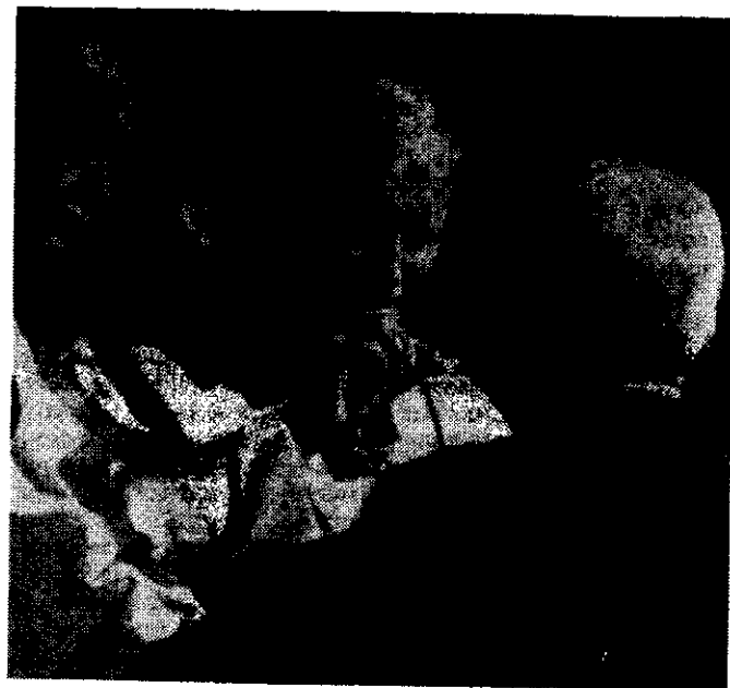
Juan Pablo II y general Leopoldo Galtieri en la comunión

A juicio de Leopoldo Galtieri, serán precisos "años" para tejer, de nuevo, las relaciones entre Argentina y Estados Unidos.