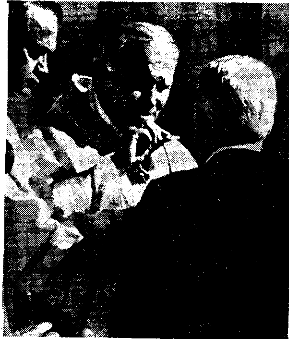
LEOPOLDO Galtieri, Presidente de Argentina, recibe la comunión de Juan Pablo II en una misa abierta que ofició ayer el Sumo Pontífice en Buenos Aires.

americana, una cadena de unión más fuerte que las cadenas de la guerra." Aleluya, Aleluya, cantaban. La respuesta en el palacio de Palermo fue unánime en su grito: "Juan Pablo segundo: te quiere todo el mundo". Aplausos y delirio en una ceremonia religiosa