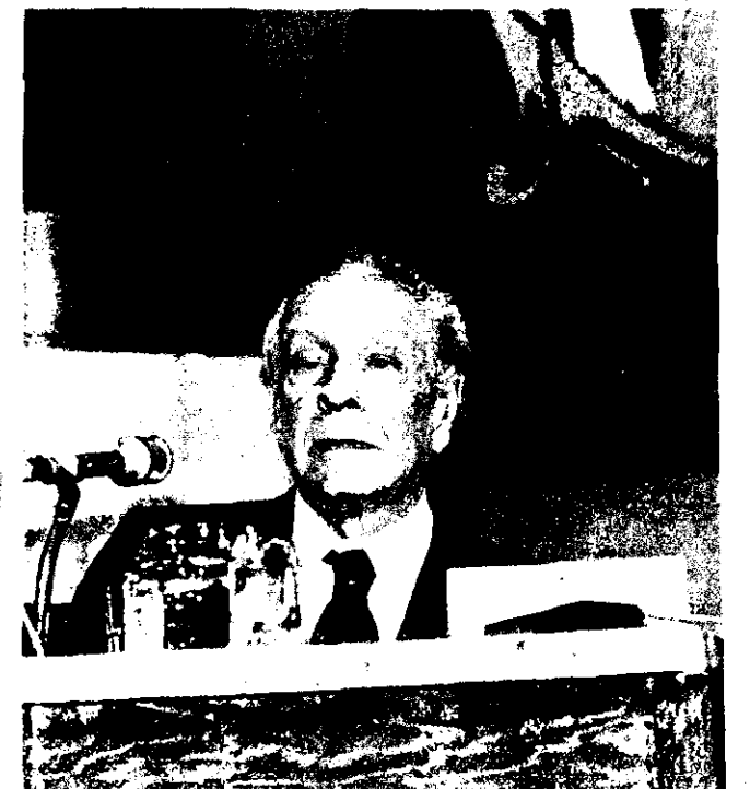
Jorge Luis Borges