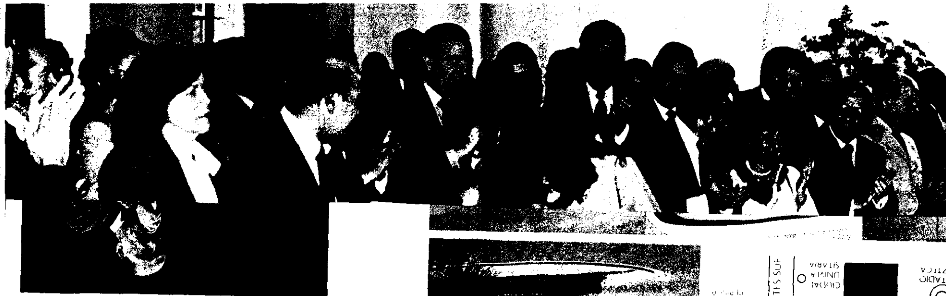
"Adios, es la última vez que vengo a México"