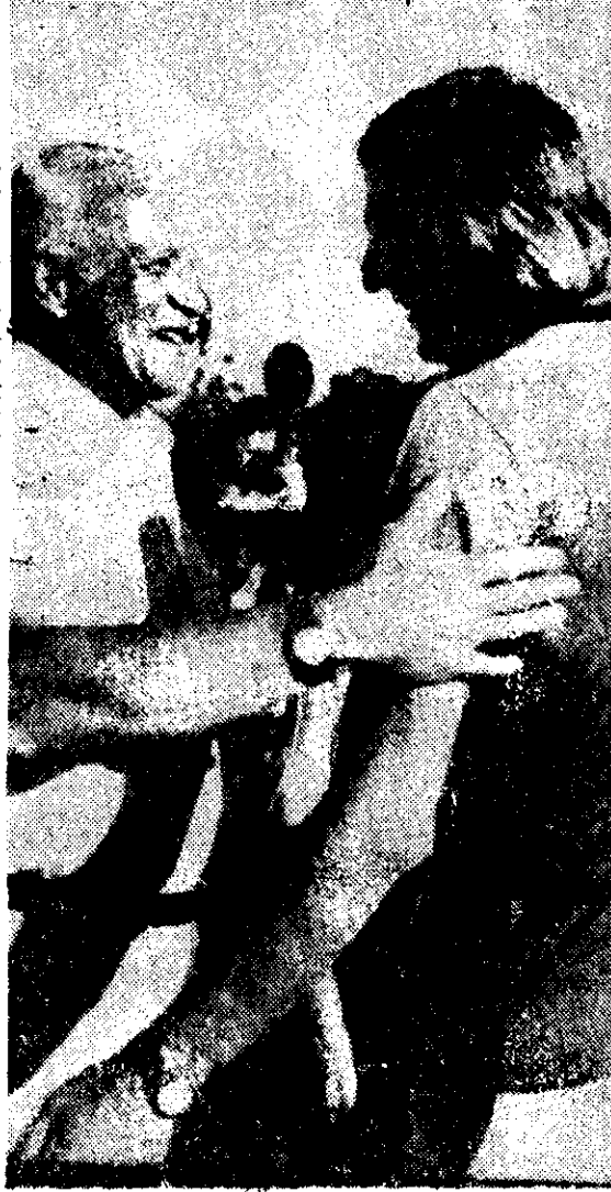
EL ABRAZO del Año llamaron los argentinos a esta escena en que el Presidente Leopoldo Fortunato Galtieri visitó a la actual Selección, campeona del mundo, y le deseó suerte al técnico Luis César Menotti.

"Yo también atravesé por este tipo de concentraciones cuando inicié mis estudios militares. Hay que poner tesón porque sólo así se sale adelante", replicó el Presidente.