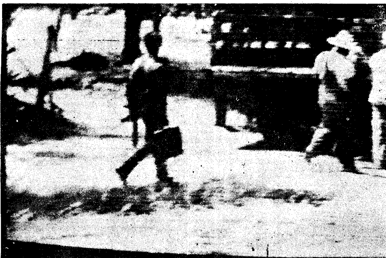
LA PRUEBA de la infamia: asesores norteamericanos provistos de armas largas (rifles M-16) en zonas de combate en El Salvador. (Fotografía tomada de la TV norteamericana).

La fotografía que acompaña esta nota constituye la prueba más reciente de la intervención directa de fuerzas armadas norteamericanas contra el pueblo salvadoreño. Tomada de un monitor de televisión de los estudios en Washington de la Cable News Network, muestra a un asesor norteamericano en un camino cercano al pueblo de San Miguel, en el departamento de Usulután, zona de frecuentes combates entre soldados de la Junta y efectivos del FMLN. El asesor, que según el pie de la AP está allí para enseñar a los salvadoreños la construcción de puentes provisionales, lleva un portafolio en una mano y un arma larga (rifle M-16) en la otra. La TV norteamericana, en sus emisiones de la noche del 11 de febrero, exhibió a cinco asesores portando idénticas armas; uno de ellos, además, llevaba un cinturón con granadas. La Casa Blanca quedó en situación embarazosa, Reagan dijo que usaban esas armas para su defensa, y al teniente coronel que comandaba el grupo se le ordenó regresar de urgencia a Estados Unidos.