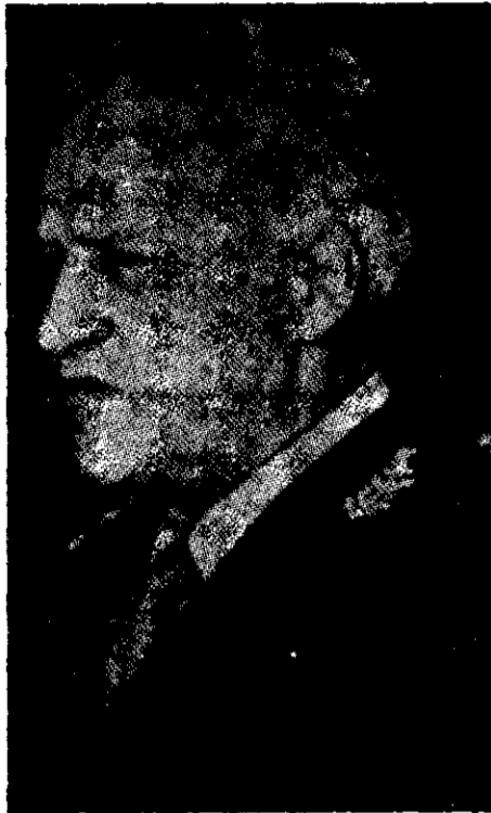
Galtieri: inconforme con los límites marítimos.

buye una violación al principio de "Chile en el Pacífico, Argentina en el Atlántico", a partir de los acuerdos complementarios del Tratado General de Límites de 1881.