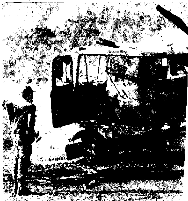
SOLDADOS salvadoreños observan cautelosamente un gi insurgentes del FMLN en la carretera Panamericana. (Radi