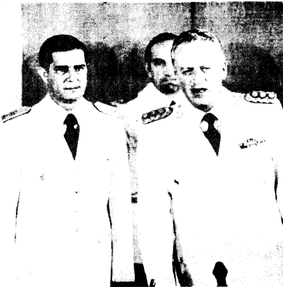
Leopoldo F. Galtieri, el presidente militar de Argentina: con paliativos económicos o sin ellos, salida electoral.

En cualquiera de ambas alternativas, resulta visible que el régimen militar que ahora encabeza el general Leopoldo Galtieri ha ingresado en un cono de sombra del cual le costará salir. Hasta los símbolos trabajan en su contra: el sexto aniversario del golpe antiperonista de 1976 (el próximo 24 de marzo) coincide con el comienzo del otoño en el hemisferio septentrional.