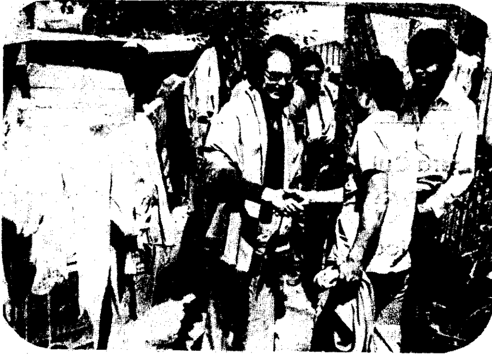
EL PREMIO NOBEL de la Paz, el argentino Adolfo Pérez Esquivel, se comprometió hoy a entregar a las Naciones Unidas los antecedentes sobre la desaparición en Buenos Aires de 27 chilenos y 3 argentinos, ocurrida entre 1974 y 1979, luego de entrevistarse con familiares de los desaparecidos en Santiago. En la foto, Pérez Esquivel saludando a un grupo de pobladores en una "ciudad perdida" de la capital chilena.