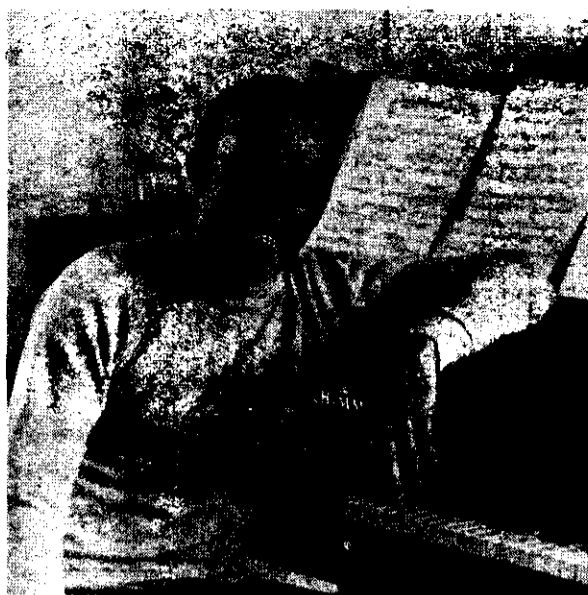
Miguel Angel Estrella

Es cuando evoca todas aquellas ocasiones en que suplantaba los rostros despóticos de los jefes o