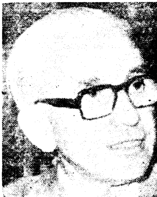
MINISTRO DE Cultura y Educación de Argentina, Juan Rafael Llerena Amadeo. Es abogado y tiene un cierto aire de intelectual, es el Gran Inquisidor —por motivos fénicos— de la docencia. Todavía no ha quemado libros en las plazas públicas.

"La cultura genuina sólo puede ser producto de la creación de los pueblos en libertad; libertad para expresarse, libertad para optar; libertad para aceptar. Y también para rechazar. El público argentino fue un público adulto, antes de que los censores lo convirtieran