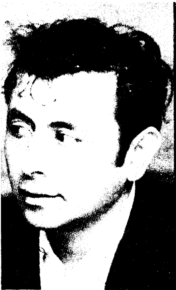
Roberto Santucho, líder del Ejército Revolucionario del Pueblo, cayó muerto ayer en un enfrentamiento con el ejército argentino, en Boner, a unos 30 kilómetros al sur de Buenos Aires.

questró masivo de refugiados latinoamericanos en Argentina en sólo un mes.