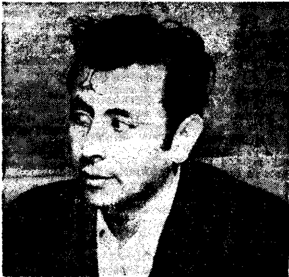
ROBERTO SANTUCHO, líder del Ejército Revolucionario del Pueblo, fue muerto anoche durante un encuentro con soldados argentinos, en Gonet, a 40 kilómetros de Buenos Aires, informó la policía.

La muerte de Santucho —que todos los indicios parecen confirmar— significa de hecho el fin de las acciones guerrilleras de la ultraizquierda neotrotzkista. En los últimos meses el ERP ha sido prácticamente diezmado en la provincia de Tucumán, en cuya zona cañera implantó, hace dos años y medio, un foco guerrillero que llegó a tener el apoyo de ciertos sectores campesinos en un primer momento. El ejército logró cortar, sin embargo, la red de abastecimiento y provisión de la guerrilla, y sus combatientes aislados en las montañas boscosas de Tucumán, al inicio de la precordillera andina. La semana pasada, el ejército asestó un duro golpe al ERP al descubrir en Córdoba la central de informaciones de la agrupación guerrillera, un inmenso subterráneo de 80 metros cuadrados donde se localizaba asimismo su principal imprenta clandestina.