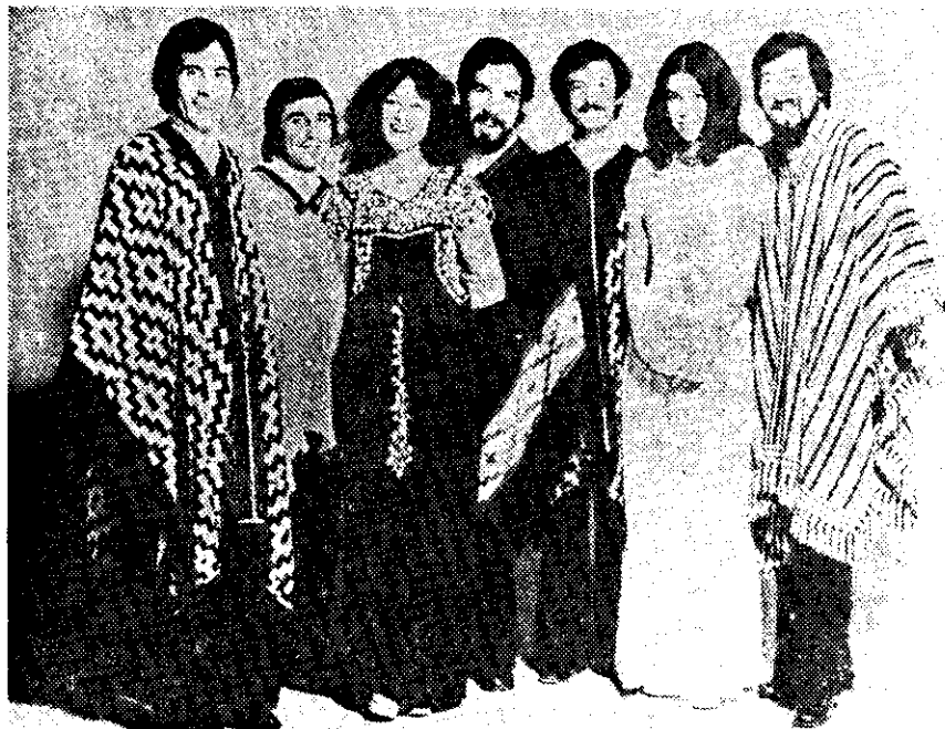
EL GRUPO DE MUSICA folclórica "Sanampay", después de una exitosa gira por ciudades de provincia, actuará hoy, a las 18 horas, en el auditorio Justo Sierra, de la UNAM.