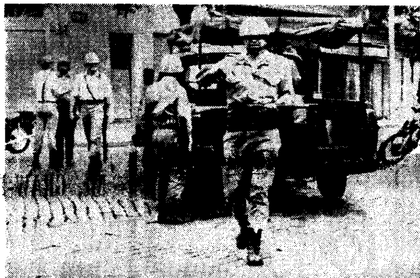
UN MIEMBRO de la brigada argentina antimotines, prohíbe a un reportero gráfico que tome fotos del penal Villa Devoto, donde ayer cientos de prisioneros se amotinaron. Hubo 50 muertos y veintenas de heridos. (Información en la página 2)

En los medios periodísticos locales se inquieran aún las circunstancias en que los reclusos murieron quemados o asfixiados.