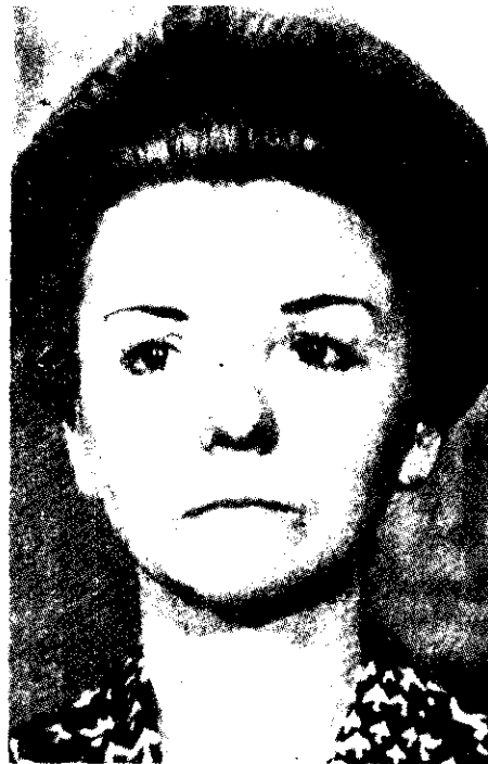
La exmandataria argentina, Isabel Perón intentó suicidarse con barbitúricos en el sitio en que se encuentra arrestada por las fuerzas militares, según una versión periodística.

La viuda del expresidente Juan Domingo Perón está detenida por la junta militar desde el golpe de Estado del 24 de marzo de 1976. En principio se la recluyó bajo el cuidado del ejército en la residencia de "El Messidor", junto al lago Nahuel Huapni, a 1,250 kilómetros de Buenos Aires.