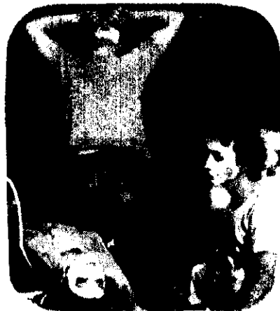
"La Chispa", realiza sus obras en creación colectiva

En cuanto a la estructuración de la obra, estos jóvenes en el momento de darle forma "capitalizan sus propias experiencias". Todos son profesionales y provienen de distintas escuelas teatrales, por lo que no les es difícil integrar un equipo de trabajo.