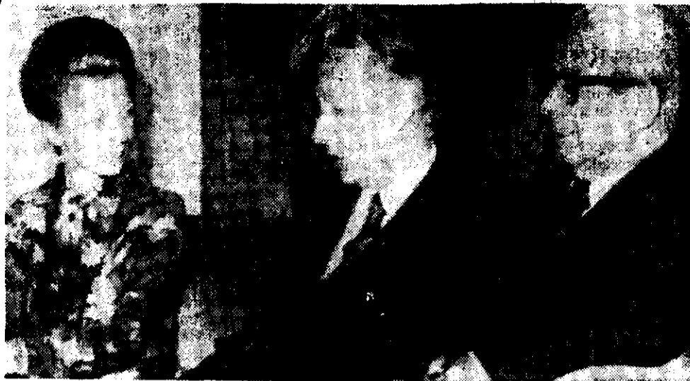
La presidenta Isabel Perón recibió ayer en la residencia de Los Olivos, en Buenos Aires, al dirigente del Senado, Italo A. Lúder, en una visita oficial. Acompaña a la mandataria Antonio J. Benítez, ministro del Interior.

Por otra parte, además de amenazar con pasar por las armas a quienes intenten propiciar el derrocamiento de la presidenta Isabel Perón, la Juventud Peronista de la República Argentina (JPRA) afirma que castigará "implacablemente a los órganos de prensa que amparados en la mentira y calumnias llevan al pueblo una imagen distorsionada de la realidad nacional". En sus amenazas, la JPRA comprende a las fuerzas armadas, el empresariado y la Iglesia.