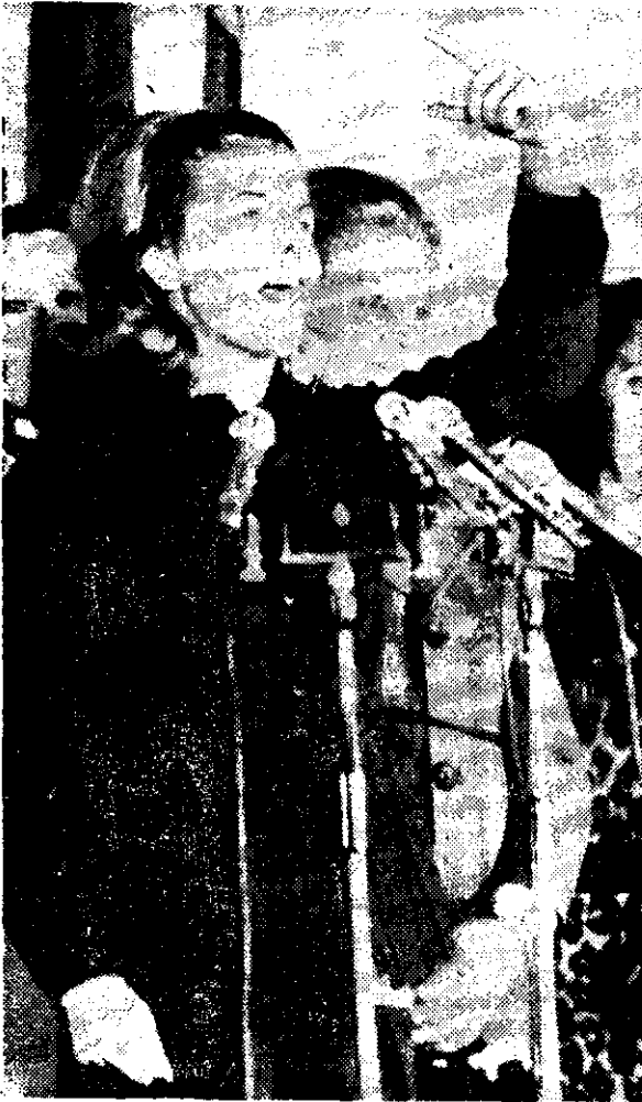
LA PRESIDENTA Isabelita Perón, que desde hace varios días padece de gripe, se dirigió ayer a los miembros de la rama femenil del partido peronista que se reunieron en Buenos Aires para manifestarle su apoyo.

"El resultado de esta reunión debe ser, tiene que ser, el principio de una nueva era de profundos cambios", continuó el portavoz cegetista; "pedimos medidas diametralmente opuestas a las que ahora se aplican".