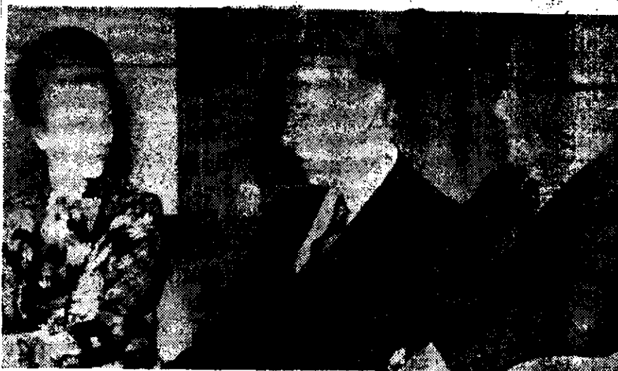
ITALO LUDER, presidente del Senado argentino, visitó ayer por primera vez a la Presidenta argentina, María Estela de Perón, en la residencia de Olivos. A la derecha, el ministro del Interior, Antonio J. Benítez.

(Información de The New York Times, The Washington Post y las agencias AP, AFP, EFE y Latín).