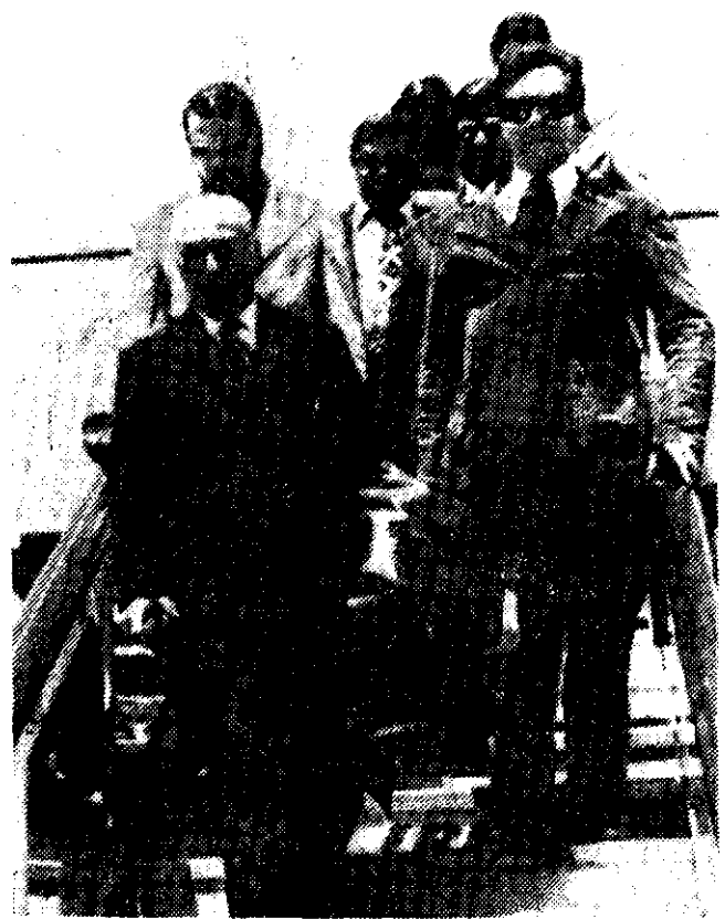
José López Rega, confidente de la presidenta de Argentina, María Estela Martínez de Perón, y ex ministro argentino de Bienestar Social, desciende del avión que lo llevó a Madrid procedente de Río de Janeiro, acompañado de sus guardaespaldas. López Rega, quien renunció la semana pasada, dijo que se encuentra en España para ponerse bajo tratamiento médico.

• Creación de un Consejo Nacional de Emergencia Económica, dentro del ministerio de Economía, para evaluar la situación y corregirla.