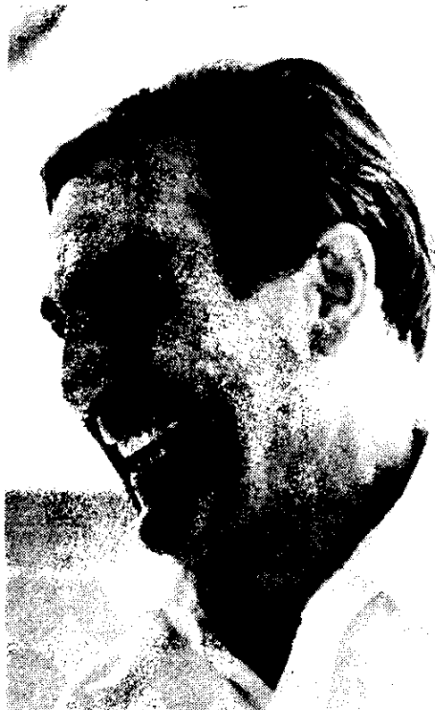
Roberto Guevara, el hermano del Ché: "Conozco los sistemas penitenciarios de todo el mundo y no hay, en el mundo capitalista, algo como este reclusorio".

"En América Latina es un problema la aplicación de un sistema penitenciario humano. En Argentina las cárceles son un infierno. Incluso en Europa y Estados Unidos se prefiere reprimir que re-adaptar".