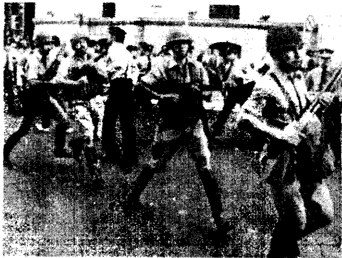
Pese al severo control policial, mil 500 personas reclamaron ayer al gobierno militar el esclarecimiento del problema de los desaparecidos en Argentina.

Saint Jean anunciará mañana, en rueda de prensa, la lista de los prisioneros políticos que recobrarán su libertad.