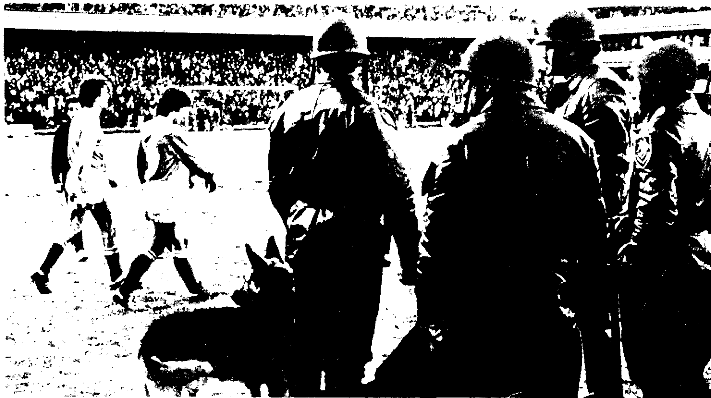
Los estadios vigilados

bre la mesa un libro de Norman Chandler, "La Ventana Siniestra", esperaba a que un parroquiano se aproximara con la pregunta casual: