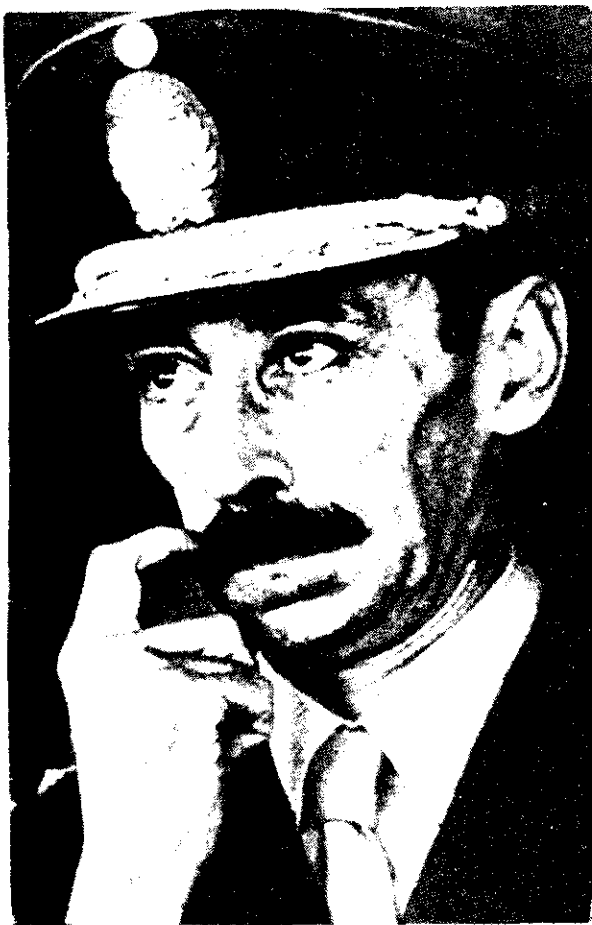
Videla nos escribe