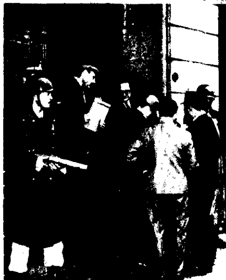
Militares en Buenos Aires

"Finalmente, señalase que conforme ha admitido la jurisprudencia de la Corte Suprema de Justicia de la Nación, la clausura y secuestro de una publicación encuentran dentro de las facultades privativas del Poder Ejecutivo, acordadas por el artículo 23 de la Constitución Nacional