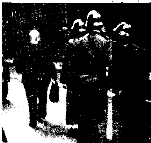
Militares en Buenos Aires

—¿Saben a quién se las compramos? A los milicos. Los muy cabrones están en la reventa.