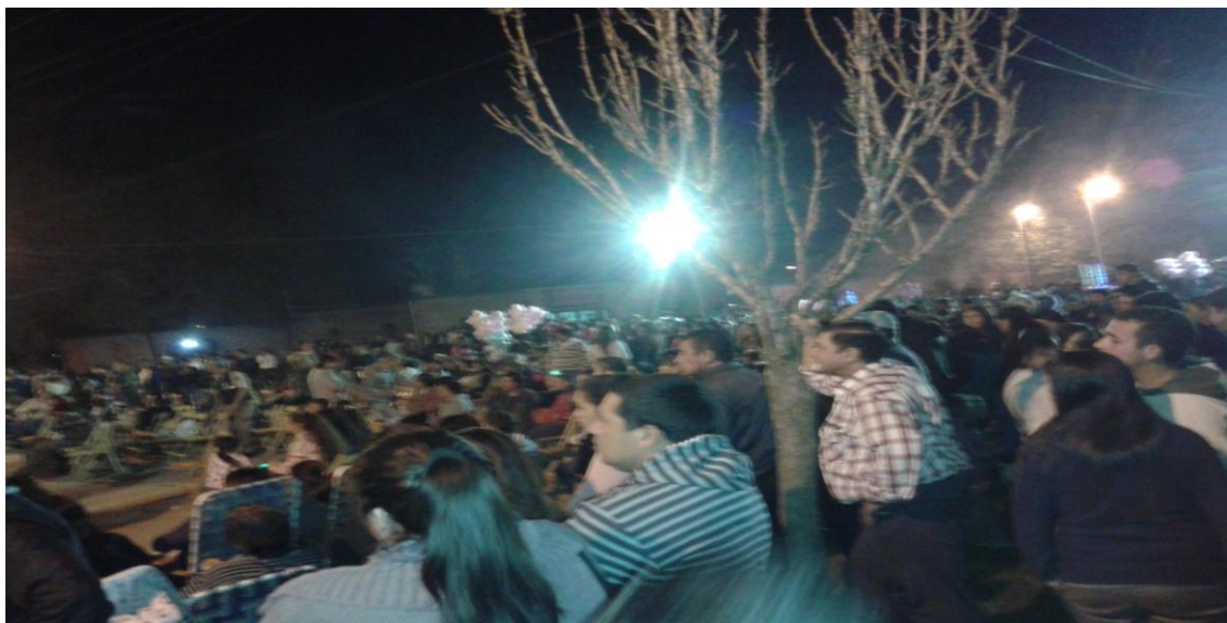
Participación popular en Aniversario de MB. Mayo 2014