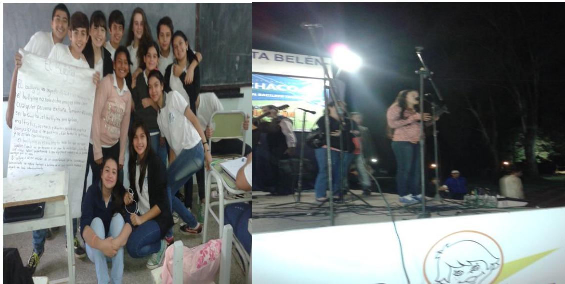
1- A la izquierda Alumnos de 8° año de la Escuela Secundaria N° 77. MB