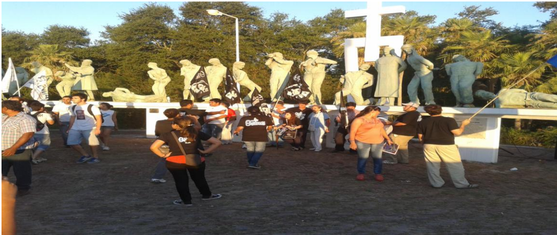
Fotografía tomada el 13 de Diciembre de 2013- Acto en conmemoración de la Masacre de Margarita Belén